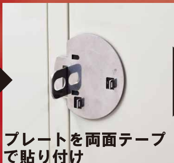
プレートを両面テープで貼り付け