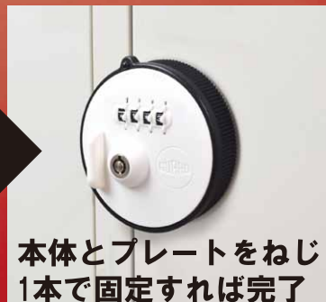
本体とプレートをねじ1本で固定すれば完了