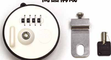
本体 + 取付プレート 取付金具 鍵