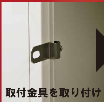
取付金具を取り付け